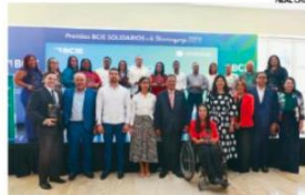
Los 18 galardonados junto a representantes de la banca.