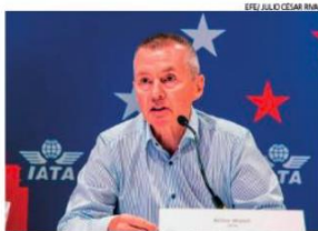
La IATA proyecta un aumento de 6.7%, en la llegada de pasajeros en 2025, equivalente a 5,200 millones.

Se espera que el próximo año el número de pasaje-