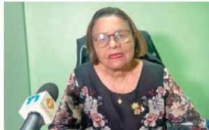
Reiteraron que seguirán en lucha hasta que sean incluidos.