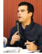
Los líderes comunitarios se mostraron optimistas.

En su primera parada en Elías Piña, Arnaud, luego de escuchar a los asistentes por más de cuatro horas, reiteró su compromiso de mejorar los servicios de agua potable y saneamiento en la provincia, tal como lo prometió el presidente Luis Abinader. En ese sentido, anunció que pronto se estará ejecutando el macroproyecto de ampliación del Acueducto Múltiple Comendador-El Llano-Guanito, que ya cuenta con su código