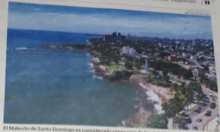
El Malecón de Santo Domingo es considerado como uno de los más hermosos del Caribe.

Otro elemento es definitivamente aplicar la resolución 2-2027 que regula el tránsito de vehículos pe-