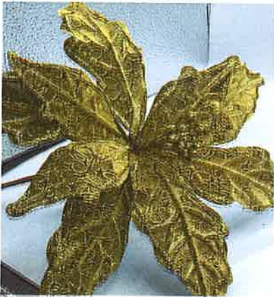
Flor de pascua dorada