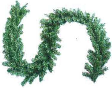
Guirnalda verde 90 pies