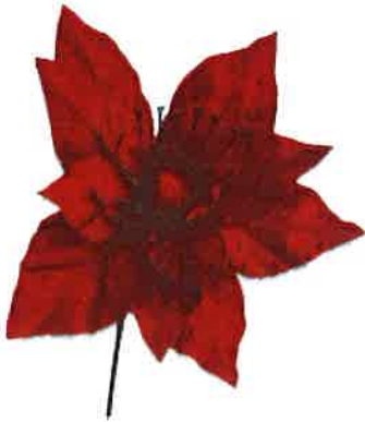
Flor de pascua roja