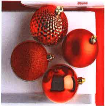
Bolas rojas de 10 y 15 cm