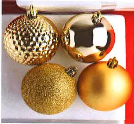
Bolas doradas 10 y 15 cm