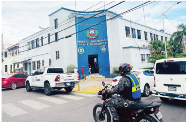
Sede de la comandancia policial de San Cristóbal.