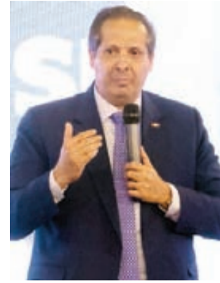
Víctor Atallah, ministro de Salud Pública.

En el Plan Estratégico 2025-2028 se establece los lineamientos del Ministerio de Salud como órgano rector con un abordaje integral y humano. El ministro Víctor Atallah calificó de altamente importante el foro del Plan Estratégico Institucional 2025-2028, debido a que la misión del Ministerio de Salud es dar inicio al proceso de definición, que