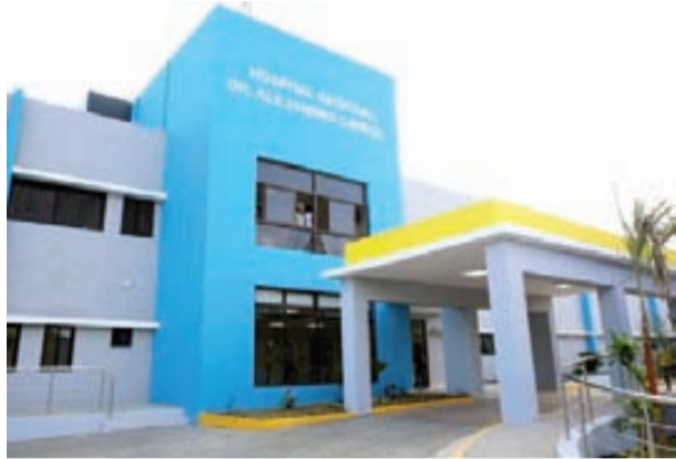
Ayer seguían siete ingresados en hospital de San Juan.