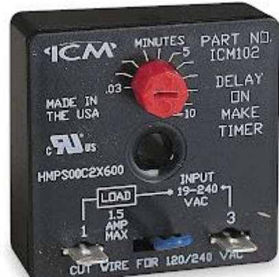
Imagen de referencia3

Grado de protección: IP40 Envoltente, IP50 Panel.