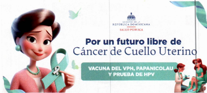
Imagen solo como referencia

Garantía por desperfectos de fábricas y/o impresión.