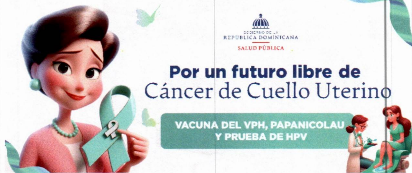
Imagen solo como referencia

Garantía por desperfectos de fábricas y/o impresión.