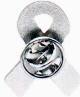
Imagen solo como referencia