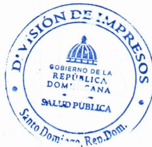
Imagen solo como referencia

Garantía por desperfectos de fábricas y/o impresión.