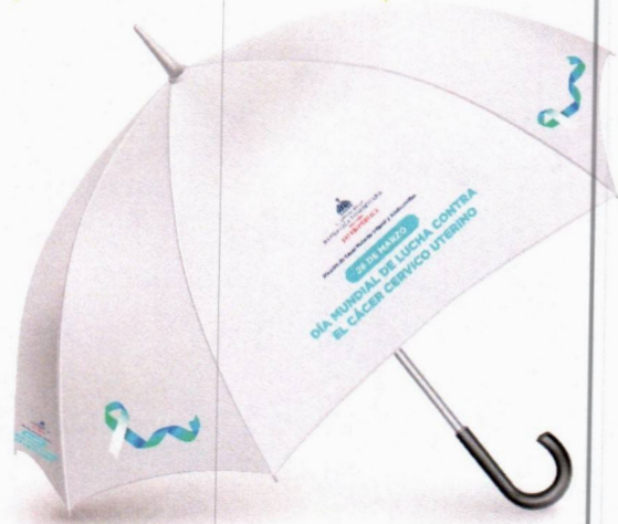
Imagen solo como referencia

Garantía por desperfectos de fábricas y/o impresión.