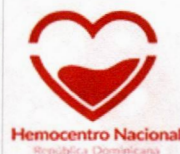
Imagen solo como referencia

Garantía por defectos de fabricación y/o impresión