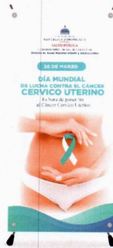
Imagen solo como referencia

Garantía por defectos de fabricación y/o impresión