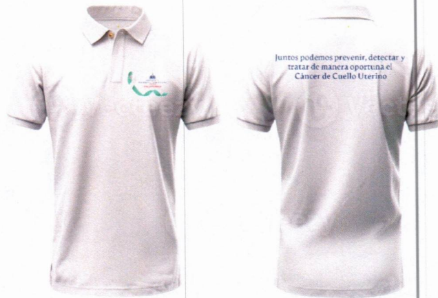
Imagen solo como referencia