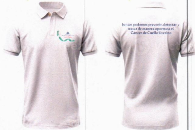
Imagen solo como referencia