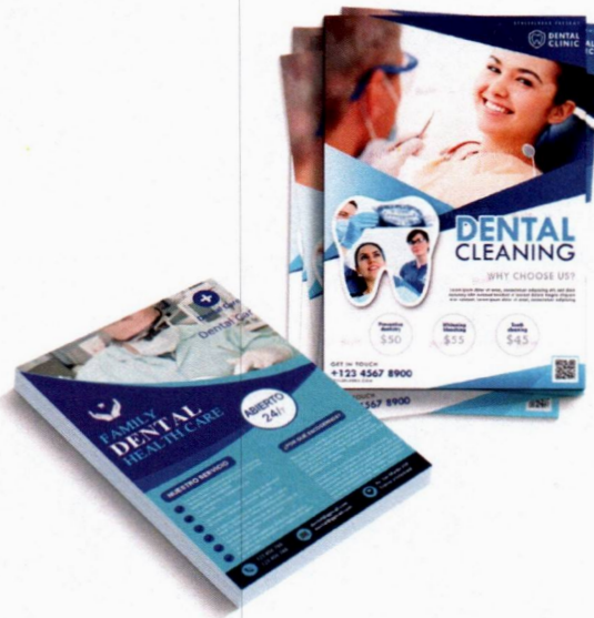
Imagen solo como referencia

Garantía por daños de fábrica o en la impresión