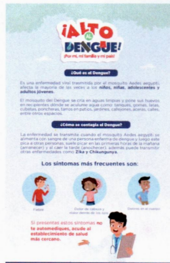
Imagen de Referencias