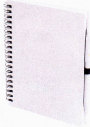
Imagen solo como referencia