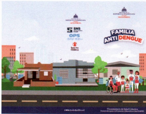
Imagen solo como referencia

Garantía por defectos de fábrica y/o impresión