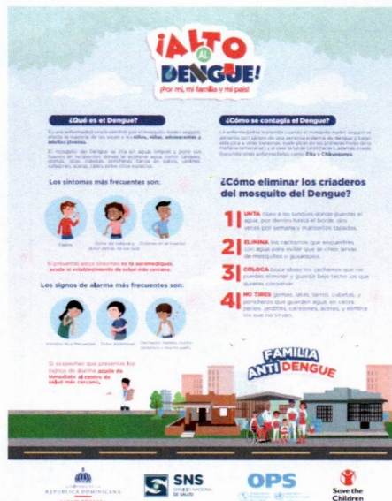
Imagen de Referencias

Garantía por defectos de fábrica y/o impresión