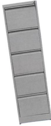
Item No. 5: