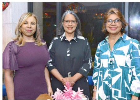
Integrantes de la Rama Femenina Contra el Cáncer en Santiago. C.M.

“Nunca hemos dejado de ayudar a los más necesitados. Nuestra labor es ardua y benéfica para aquellos que nos ven como una esperanza de vida porque no pueden acceder a los costosos tratamientos para la cura y control del cán-