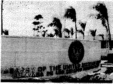
Si van a ingresar a la Embajada sólo lleva documentos.

Al enumerar la lista de los objetos prohibidos en la Embajada de los Estados Unidos en la República Dominicana, el Centro de Atención de Visas usa la misma lista para prevenir que ciertos objetos sean introducidos al lugar. "Tome