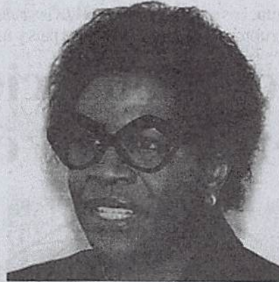
Emmelle Prophète Milcé, ministra de Justicia de Haití.

La Red Nacional de Defensa de los Derechos Humanos dice que toma en serio este ataque dirigido contra Polifront y solicita a la Inspección General de la PNH abrir una investigación, a fin de determinar responsabilidades y trasladar al frente a las autoridades judiciales. "todas las personas que intervienen en el mismo.