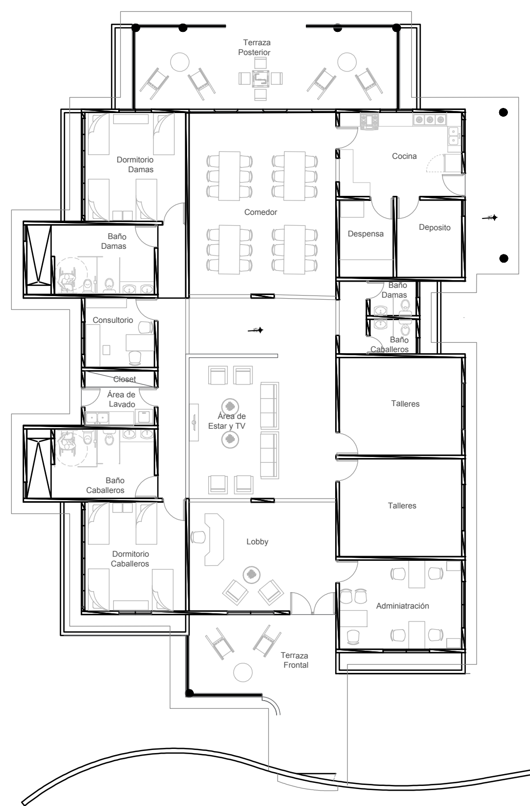
1 PLANTA ARQUITECTONICA (ILUSTRATIVO) E-1 NO ESCALA