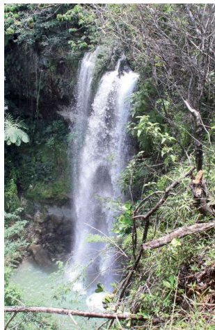
Los saltos son de fácil acceso. M.V.

Es de mayor espesura o grueso de agua, que al caer a la charca emite un sonido que simboliza el trinar de la avecilla que honra su nombre. Aquí el astro sol preña la charca de rayos, al estar en un cañón de rocas que lo protege. ●