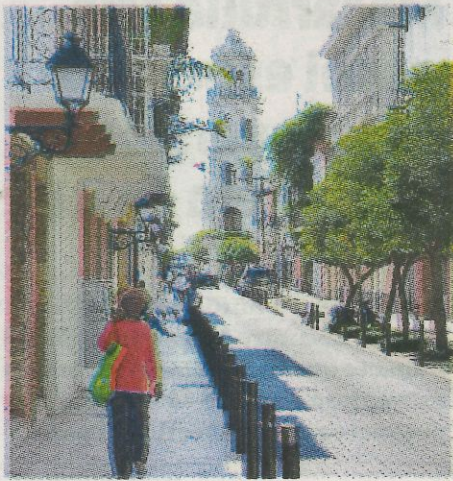
El objetivo principal del programa es revitalizar la Ciudad Colonial.