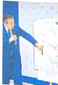
Orlando Jorge Mera explica las medidas aplicadas.

Medio Ambiente reiteró la prohibición de que se hagan nuevas siembras y dijo que "se abordan aspectos relacionados al retiro de cultivos de ciclo corto y alternativos a los de ciclo largo, así como los planes de reubicación acorde al Censo de Familias y Predios Agrícolas que fue elaborado este año por un equipo multidisciplinario con la compañía de la Asociación de Productores Hortícolas de la Horma