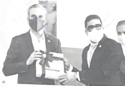
El presidente Luis Abinader recibe una biblia de mano de Dio Astacio.