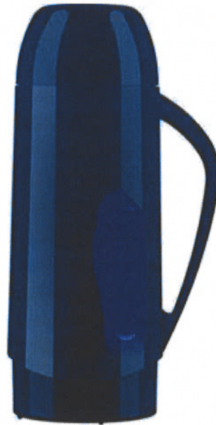
IMAGEN DE REFERENCIA TERMOS PARA VIAJES, CAPACIDAD 500 ML