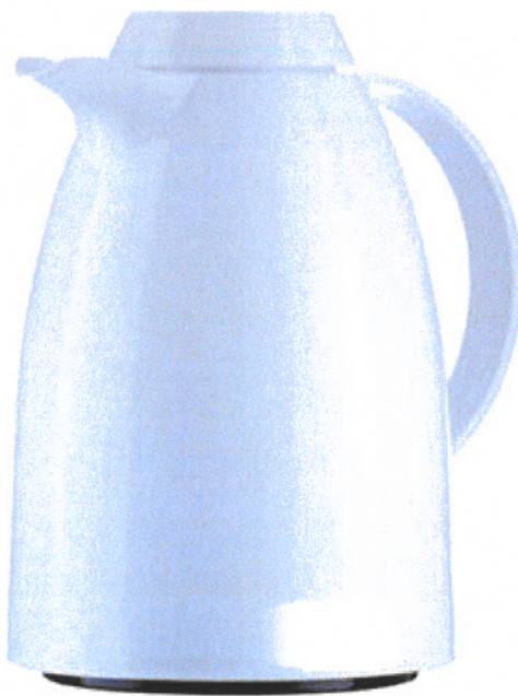
IMAGEN DE REFERENCIA TERMOS PARA CAFÉ BLANCO, CAPACIDAD DE 1 LITRO, 750 ML.