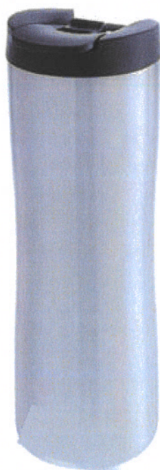
IMAGEN DE REFERENCIA TERMOS PARA CAFÉ CROMADO