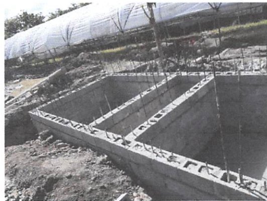
Ilustración 1. Planta de tratamiento de la Dirección Regional Norte, Santiago.