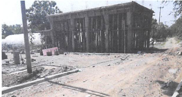
Ilustración 3. Taller de mecánica de la Dirección Regional Norte, Santiago