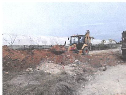
Ilustración 4. Movimiento de tierra en la Dirección Regional Norte, Santiago

Por otra parte, en el presupuesto base no se contempló la partida de Aires Acondicionados, debido a no ser requeridos, en cambio, al momento de ser ejecutada se solicitó el suministro y la instalación de dicha partida, ver ilustración 5.