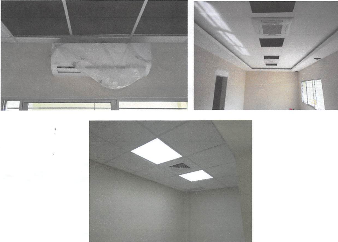
Ilustración 5. Aires acondicionados en la Dirección Regional Norte, Santiago

La implementación de estas partidas en la ejecución de la obra, conllevó la elaboración de un presupuesto adicional, cuyo monto es la suma de RD$8, 860,419.47, el cual anexamos para fines de aprobación. Este monto corresponde al 25% con respecto al presupuesto base, por tanto, queda circunscrito dentro del 25% que establece la ley No. 340-06 sobre Compras y Contrataciones de Bienes, Servicios, Obras y Concesiones.