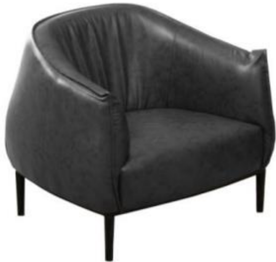
Butaca Florence de una persona

Butaca Florence de una persona En piel sintética color negro, Medidas:31" x 31" x 31"Garantía de un (1) año sobre defectos de fabricación,