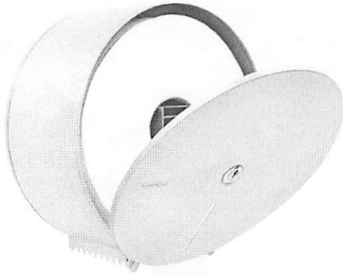
Dispensador de Papel Higiénico