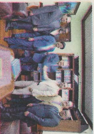
Autoridades trataron el tema. - F.E.