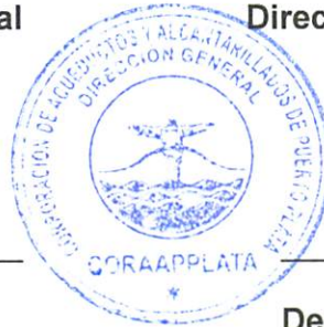
Dauris Toribio Depto. Planificación y Desarrollo