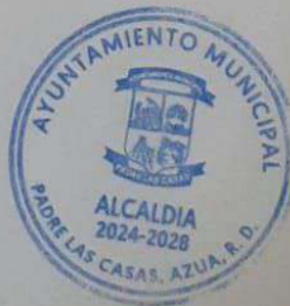
Máximo Stawal Romero Aquino Alcalde Municipal