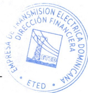
Elaborado por: Javier Fernandez Madera Perito Financiero