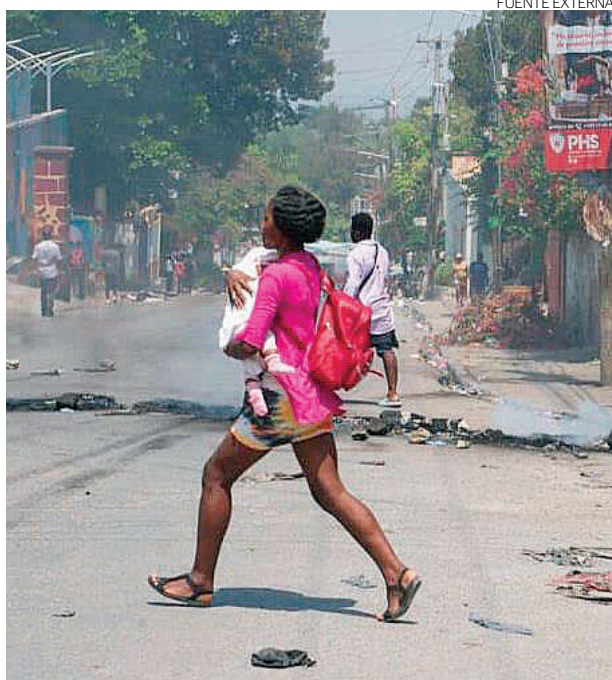
La violencia armada en Haití se ha intensificado.

Entre el 1 de septiembre y el 30 de noviembre de 2025, Haití registró 1,991 homicidios, entre ellas 142 mujeres, 12 niñas y 44 ni-