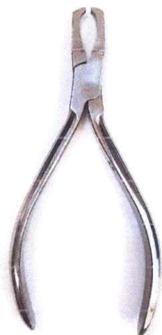
Pinza quita brackets