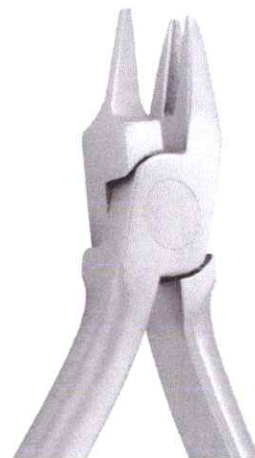
PINZA DE TRES PICOS

"AÑO DE LA CONSOLIDACION DE LA SEGURIDAD ALIMENTARIA"