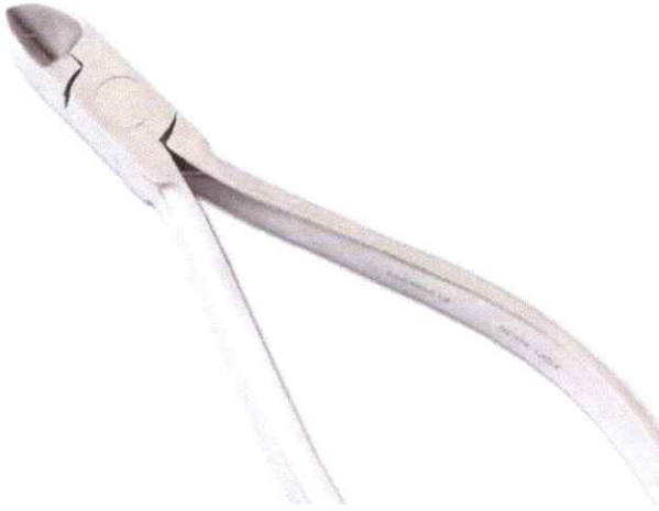
Pinza corte recto pesad

"AÑO DE LA CONSOLIDACION DE LA SEGURIDAD ALIMENTARIA"