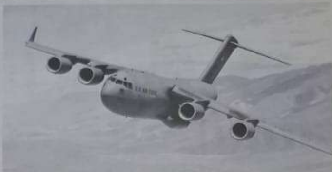
Las aeronaves militares estadounidenses llegaron al país por la Base Aérea de San Isidro y por el Aeropuerto Internacional de las Américas.

En la Base Aérea de San Isidro, estuvieron a cargo del Ministerio de Defensa de la República Dominicana.