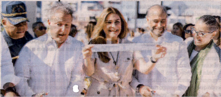
Ejecutivos de APAP y la alcaldesa dejaron inaugurados los espacios. F.E.

su satisfacción por formar parte de esta gran iniciativa de APAP, la cual evidencia la importancia del trabajo mancomunado entre los sectores público y privado. ● elCaribe