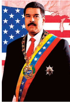
con una publicación en el

El Departamento de Estado estadounidense confirmó la designación oficial de esta organización como FTO