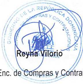
Enc. de Compras y Contrataciones

En la Ciudad de Santo Domingo, Distrito Nacional, República Dominicana a los once (11) días del mes de noviembre del año 2025.