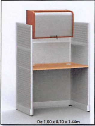
De 1.00 x 0.70 x 1.44m