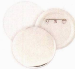
Imagen solo como referencia

Se requiere muestra similar para posterior evaluación.