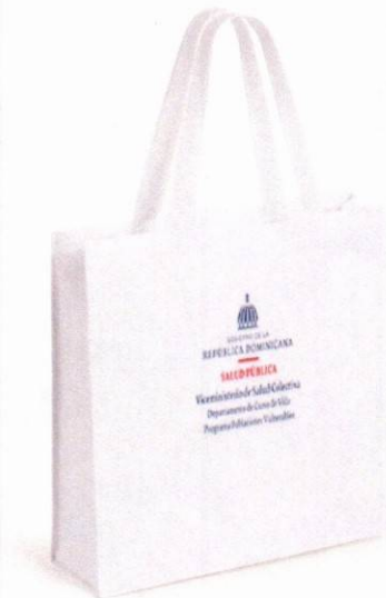
Imagen solo como referencia