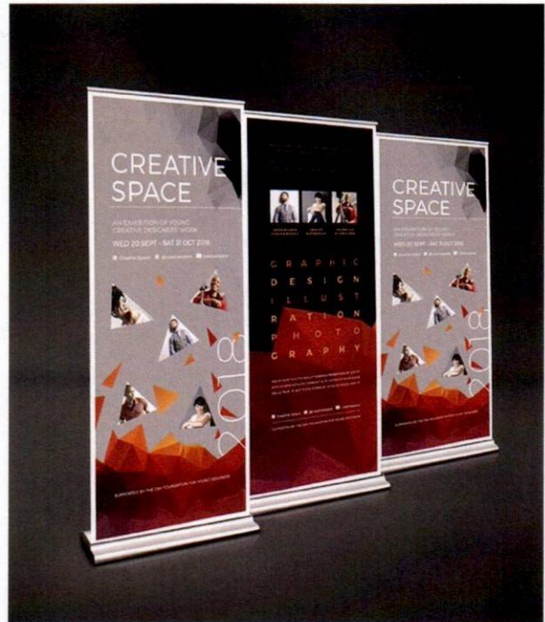
Imagen solo como referencia