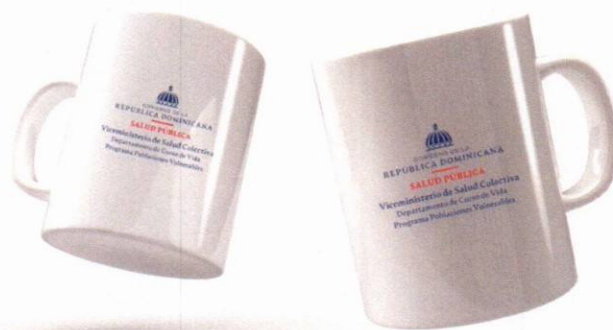
Imagen solo como referencia