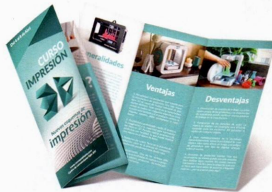
Imagen solo como referencia