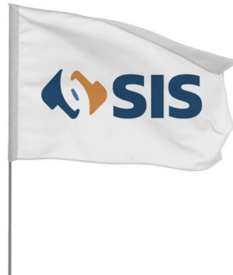
Bandera Institucional Variante