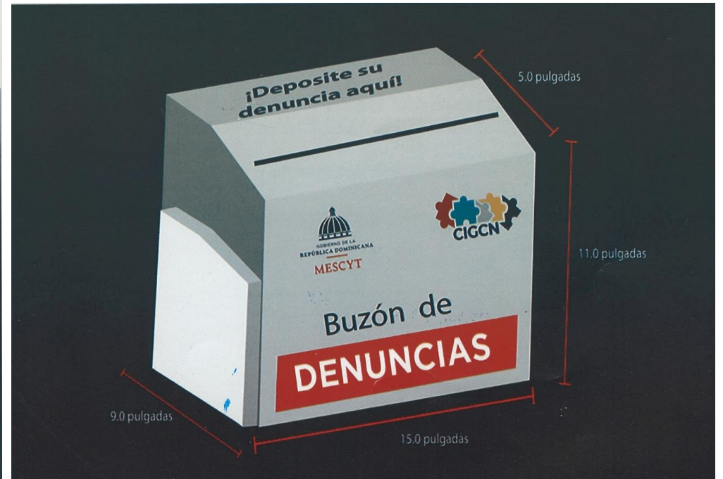
Buzón de Denuncias OAI