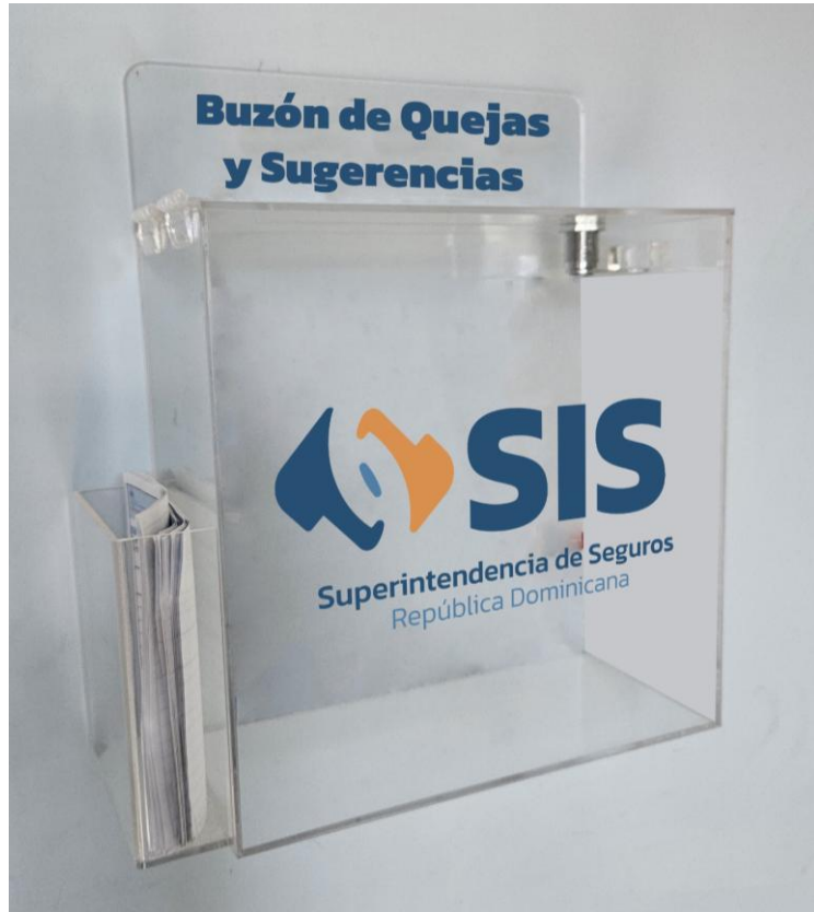
Buzón que Quejas y Sugerencias