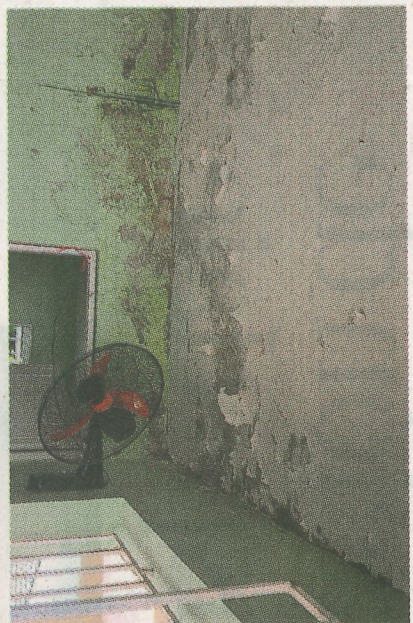
Una de las escuelas que necesitan intervención.