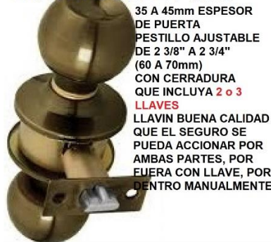
LLAVIN DOBLE PUÑO

35 A 45mm ESPESOR DE PUERTA PESTILLO AJUSTABLE DE 2 3/8" A 2 3/4" (60 A 70mm) CON CERRADURA QUE INCLUYA 2 o 3 LLAVES LLAVIN BUENA CALIDAD QUE EL SEGURO SE PUEDA ACCIONAR POR AMBAS PARTES, POR FUERA CON LLAVE, POR DENTRO MANUALMENTE