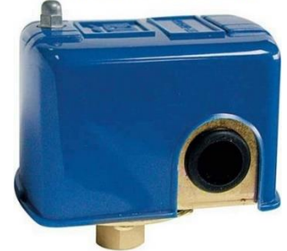
MOD. 378102 4-10 BAR CAPACIDAD: 150 PSI