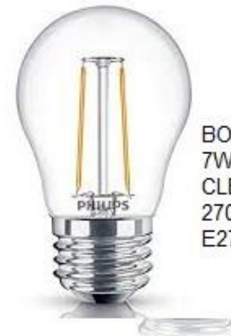
BOMBILLO LED 7W CLEAR 2700K E27

35 A 45mm ESPESOR DE PUERTA PESTILLO AJUSTABLE DE 2 3/8" A 2 3/4" (60 A 70mm) CON CERRADURA QUE INCLUYA 2 o 3 LLAVES LLAVIN BUENA CALIDAD QUE EL SEGURO SE PUEDA ACCIONAR POR AMBAS PARTES, POR FUERA CON LLAVE, POR DENTRO MANUALMENTE