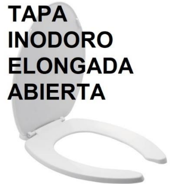
TAPA INODORO ELONGADA ABIERTA

CEMENTO DE PVC TAMAÑO: 16 ONZ secado rápido. Especialmente formulado para un empalme más fuerte entre plástico PVC y tuberías rígidas o flexibles donde condiciones húmedas pueden existir. Para tuberías y piezas de PVC SCH 40 y 80 para sistemas de agua potable y sistemas de agua presurizada en cisternas, piscinas y Jacuzzi.