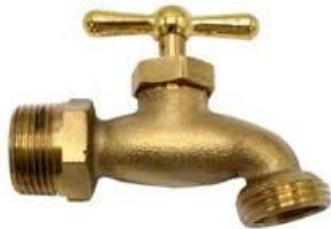
LLAVE DE CHORRO DE 3/4