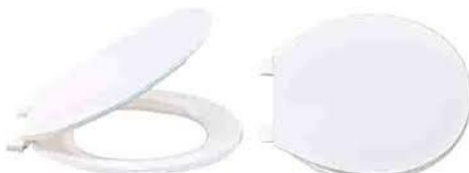
TAPA PARA INODORO TIPO: REDONDA COLOR: BLANCA MOD. PN65901