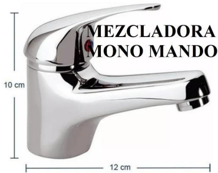
MEZCLADORA MONO MANDO

NOS RESERVAMOS EL DERECHO DE RECIBIR O NO MERCANCIA