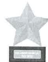
Modelo pin Colaborador del año