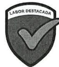
Modelo pin labor destacada