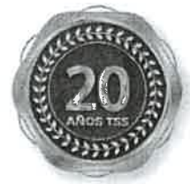
Modelo pin 20 años antigüedad