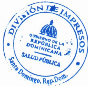
Imagen solo como referencia