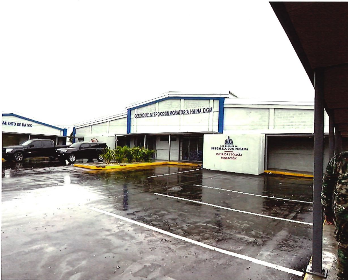
7. Trabajos de Compartimentado en este Centro