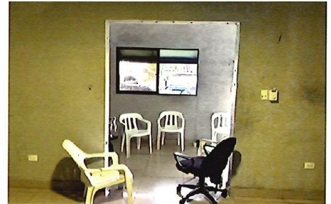
10. Situación actual.