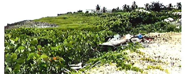
2. Muro Bloques en Zona Baldía.