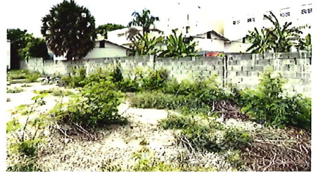
3. Muro Bloques Completo.