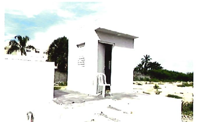
4. Caseta Seguridad Existente (Referencia).