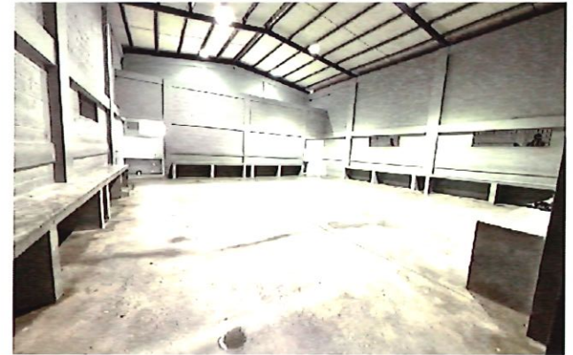
8. Interior Actual