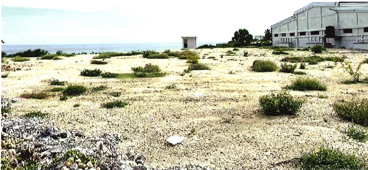
1. Muro Bloques en Zona Compactada con Caliche.