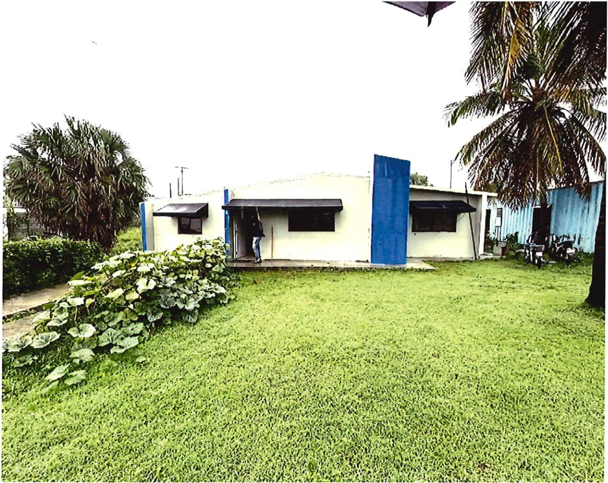
9. Edificio a intervenir - Enfermería