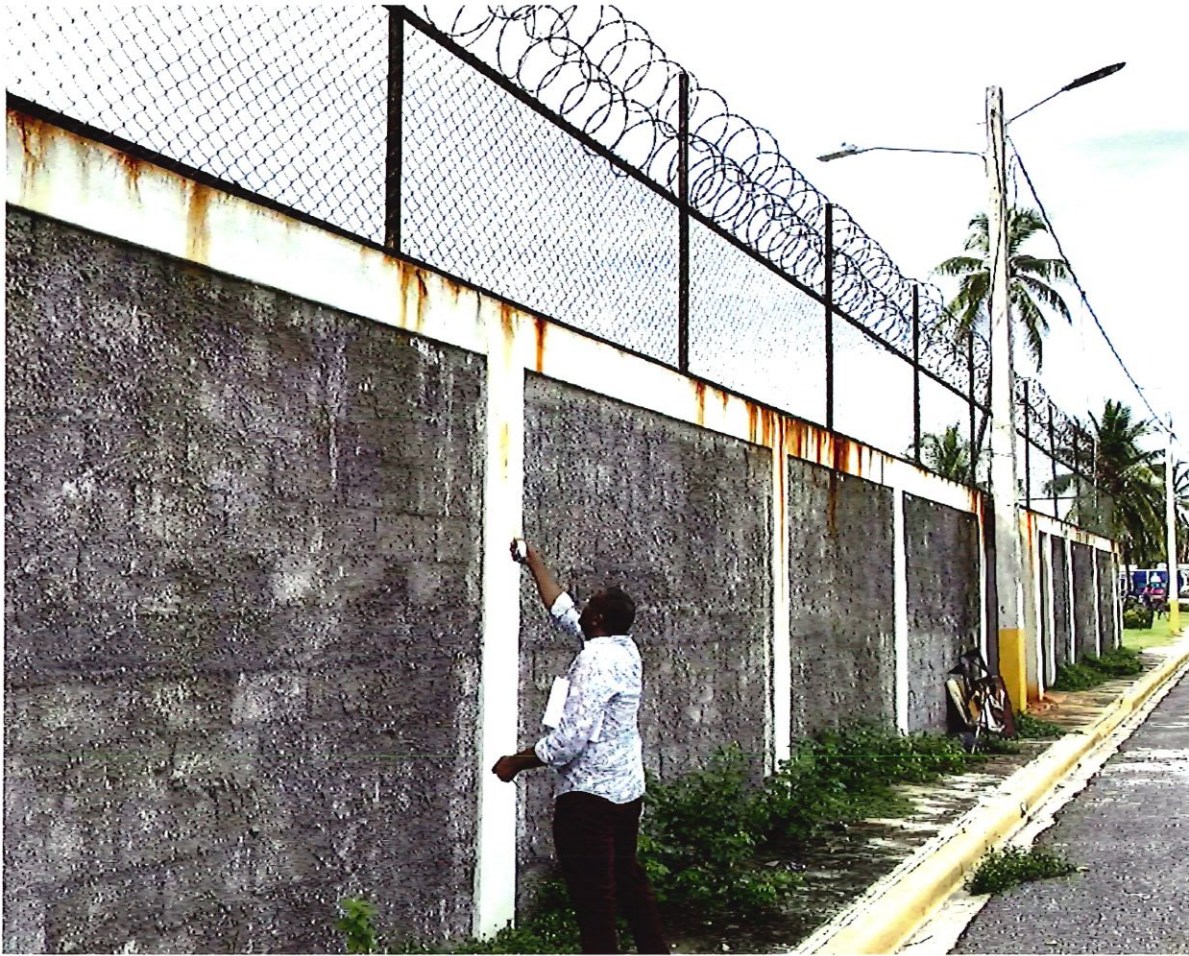
4. Muro Bloques Existente (Referencia).